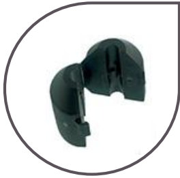
Lest clip 275 g