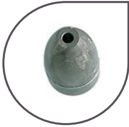
Lest en résine chargée 175/250/350 g