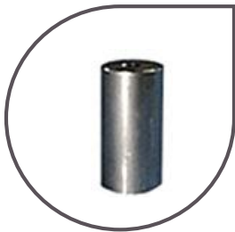
Lest en inox AISI 316 L 230 g